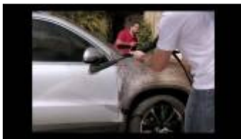
Trecho da campanha de TV da Kärcher

Presente há 36 anos no Brasil, a Kärcher, líder mundial em soluções de limpeza de residências, jardins, grandes áreas e limpeza de ambientes profissionais, começa a maior campanha de divulgação da marca já realizada. O comercial será veiculado nas principais emissoras de TV, em horário nobre.